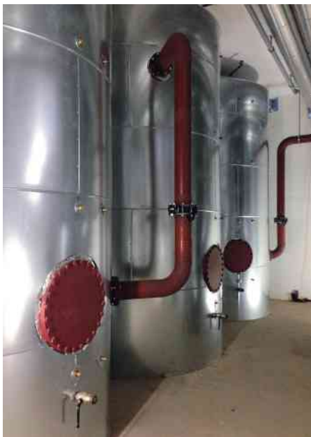
Die Pufferspeicher in der Energiezentrale bilden einen integralen Bestandteil des Energiesystems.

gesetzt. Mit zwei in der Energiezentrale platzierten Wärmepumpen zu je 300 kW Leistung und Ammoniak (NH 3 , R-717) als Kältemittel wird die Wärme aus dem Grundwasser gewonnen und in das auf dem Areal installierte Niedertemperaturnetz gespeist. Als Planungswerte für die Wärmepumpen galt eine Jahresarbeitszahl (JAZ) von 5.5 bei der Heizung und von 3 für die dezentrale Warmwasserbereitung. Fünf Pufferspeicher bilden in der Energiezentrale einen integralen Bestandteil und werden bis zu 40°C aufgeheizt. In jedem Gebäude sind dezentrale Wärmepumpen und separate Pufferspeicher installiert, die zur Bereitstellung von Trinkwarmwasser eingesetzt werden. Dieses wird auf 53 bis 60°C erwärmt. Bernhard Schmocker erläutert die weitere Entwicklung: «Da der Bedarf in der nächsten Zeit sukzessive wachsen wird, wollen wir schrittweise vorwärts gehen und auch die Solarstrom-Verwendung sorgfältig ana-