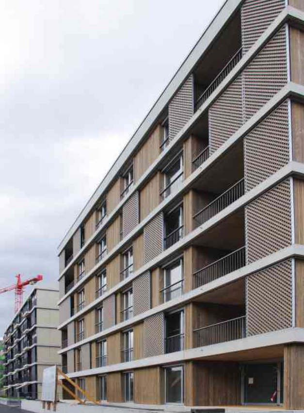
Die Grundeigentümerin von Erlenmatt Ost – die Stiftung Habitat – entwickelt das Areal nach den Zielsetzungen der 2000-Watt-Gesellschaft.