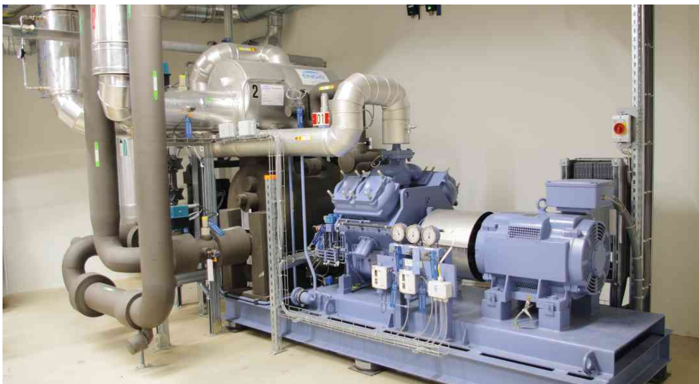
Die Wärmepumpe arbeitet mit Ammoniak (NH 3 , R-717) als Kältemittel und leistet maximal 300 kW. Die beiden installierten Einheiten dienen auf effiziente Weise der Kopplung des Wärmenetzes an das Stromnetz.

Eigenverbrauch mit 500 installierten Zählern Der Solarstrom wird – nebst der Versorgung der Bewohner des Areals – auch für den Betrieb der Wärmepumpen ein-